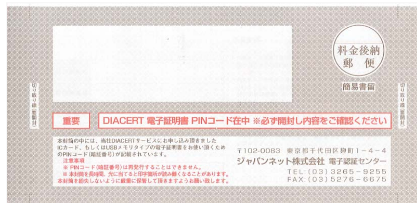
PINコード通知書イメージ